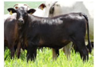
Progênie cruzamento industrial no MS