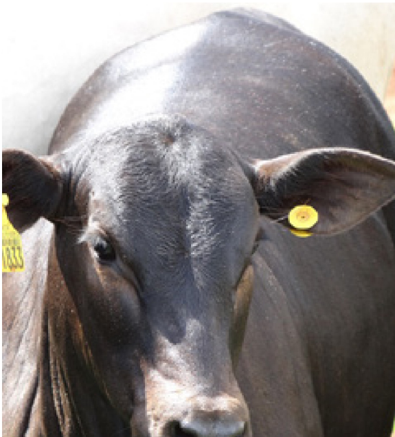
Progênie cruzamento industrial no PR

REG. N°: AAA17454728 • Nascimento: 01/06/2013