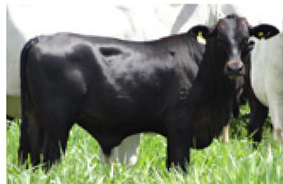
Progênie cruzamento industrial no PR

Frame: 6.2 AA 150 cm CC: 180 cm CE: 42 cm CG: 60 cm LG: 70 cm PT: 230 cm