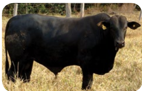
Progênie cruzamento industrial no MT