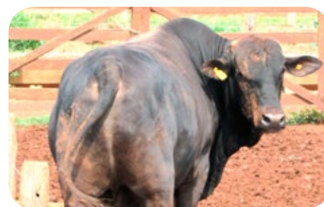
Progênie cruzamento industrial no MT