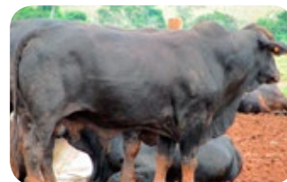
Progênie cruzamento industrial no MT