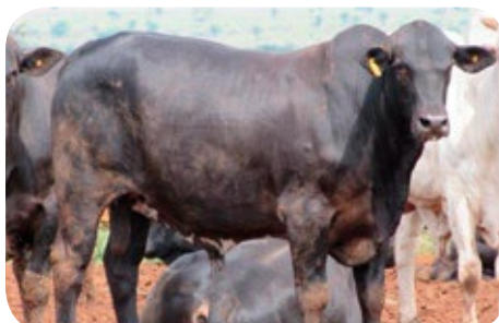
Progênie cruzamento industrial no MT